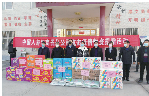
中国人寿平顶山分公司为汝州市王寨乡某村送去价值2万余元的防控物资和生活用品

疫情缓解后,我市各行各业陆续复工复产,我市保险行业在支持实体经济复工复产中提供了有力的保障。为确保相关政策落实到位,3月,平顶山市保险业支持实体经济座谈会召开。针对当前的金融经济形势,我市各家保险公司都制定了关于支持小微企业发展、助力脱贫攻坚的相关政策。如:保险责任扩展、赔付流程简化、线上服务完善、到期保单延缓、农网服务建设、专项保险推广、信用保险保障、优惠政策实施等具体事项进行重点探讨。会议对各家公司提出要求:强化政策落实,抓好服务工作质量,应减尽减、应保尽保、应赔尽赔,维护好保险市场秩序;继续做好续期服务,维护好存量客户,不要因为企业的一时困难造成客户流失;加强沟通,了解更多优惠政策出口,聚焦产品扶贫、乡村振兴等问题,做好金融对口工作,各取所长、规范合作。并对具体措施的落地实施,如何共同推动工作开展等方面给予明确指导。在此次疫情防控阻击战中,我市保险业始终贯彻落实中央、省、市有关防控决策部署,紧密围绕市金融工作局和银保监分局的指导要求,坚持以疫情防控为要务,充分发挥了行业优势,着力强化了理赔工作,以实际行动践行了责任和担当,彰显了我市保险业的良好形象。未来,平顶山保险业将继续践行服务理念,坚定信心、众志成城,为全面打赢新冠肺炎疫情阻击战贡献更大力量。