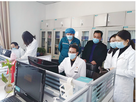
农发行平顶山分行信贷人员到宝丰县人民医院上门为医护人员办理天使贷