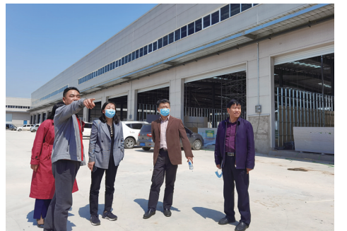
新华社社领导深入泰顺达物流园,调研企业复工复产工作

暮春时节,繁花似锦,疫魔渐退,各行各业正在稳步复工复产。回望这场没有硝烟的战争,既有前方医护人员义无反顾、逆风前行,用生命守护生命,也有后方社会各界在联防联控、物资保障、民生供应等方面攻坚克难、全力以赴,凝聚起齐心抗“疫”的硬核力量。