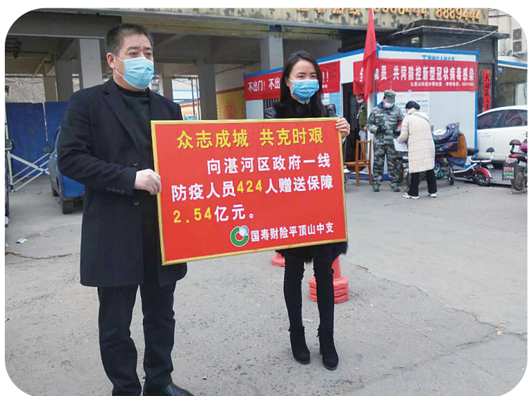
中国人寿财险平顶山中心支公司向防疫人员赠送保险保障

疫散春归,4月的鹰城显得格外清爽。随着各行各业复工复产,社会秩序稳步恢复。年初,新冠肺炎疫情突如其来,一时间,一场没有硝烟的疫情防控阻击战在全国上下全面打响。平顶山市各级党委、政府及相关单位迅速投入到疫情防控工作中。保险业作为社会运行中重要一环,扶危救困是其使命所在,助力打赢疫情防控阻击战也是其义不容辞的责任和义务所在。在平顶山市委、市政府的坚强领导下,在平顶山银保监分局的指导下,我市保险业协会快速反应,向全市保险业发出抗击新冠肺炎疫情爱心捐赠倡议书。各会员单位认真贯彻落实疫情防控工作要求,积极开展公益捐赠,强化理赔,多种措施支持复工复产,积极做好疫情防控工作,为全市疫情防控构筑起坚实后盾,凸显经济“减震器”和社会“稳定器”功能,鹰城保险人以实际行动践行了行业价值与社会担当。