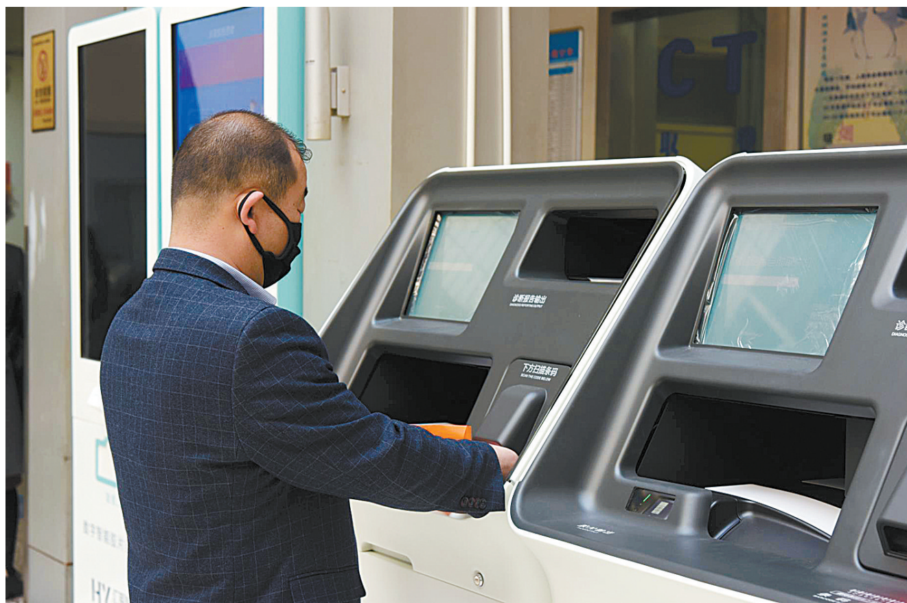
自助取片机方便患者