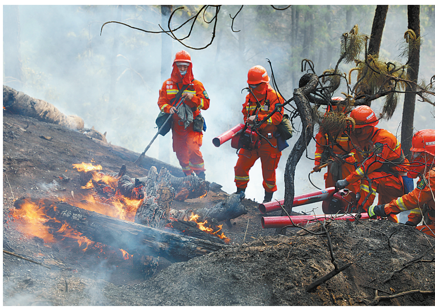
四川凉山森林火灾继续扑救

文章提到，新冠病毒无症状感染者是指无相关临床症状，如发热、咳嗽、咽痛等可自我感知或临床识别的症状与体征，但呼吸道等标本新冠病毒病原学检测阳性者。