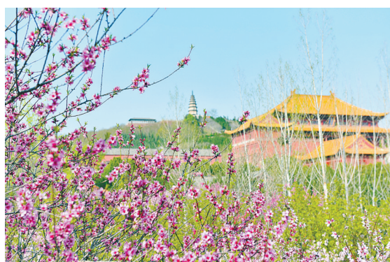
3月23日正午,从西侧塔林望去,千年古刹香山寺矗立山间,静谧威严。