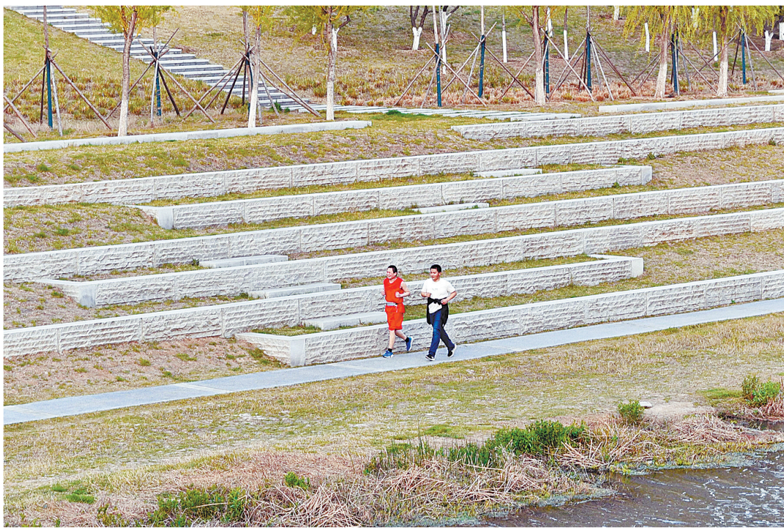
3月23日傍晚,在湛河新华区西高皇段,市民与春光相约,跑步健身,活力盎然。