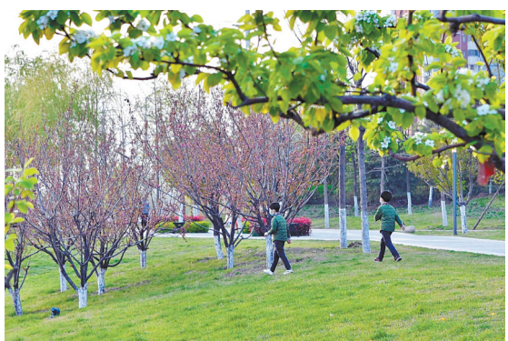
3月23日,湛河乌江口沿岸梨花幽香、桃花绽放,吸引着孩童追逐玩耍。