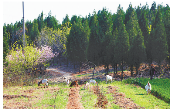
3月23日中午,新华区香山管委会岳岳村村民在农田里牧羊,好一幅美丽的田园画卷。