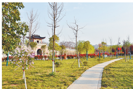
3月23日,春光恰好,新华区香山管委会石桥营村一派欣欣向荣的景象。