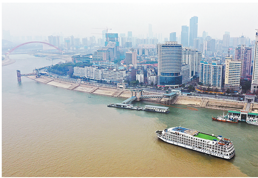
医护人员的水上住所“蓝鲸”号游轮抵达武汉

员驻地,孙春兰看望并慰问医疗队员,督促指导湖北、武汉有关部门做好日常生活保障工作。 孙春兰说,广大医务人员是新时代最可爱的人,大家夜以继日、连续奋战,体现了大爱无疆、医者仁心的崇高精神,不愧是生命的守护神、疫情防控的英雄。中央指导组代表党中央向医务人员表示敬意和感谢。她强调,要切实加强对医院感染防控工作,做好医务人员科学防护和人员培训,制定关心关爱医务人员的政策方案,统筹安排好轮休,加强医务人员的后勤保障和人文关怀,让广大白衣战士真切感受到党中央的温暖和全社会的关爱。同时,要加强对保障方舱医院正常运转的公安干警、环卫工人、基层社区干部、志愿者的关心关爱。 目前,全国地方和军队系统已派出4万余名医务人员驰援湖北,中央指导组为每名医务人员准备了生活用品。