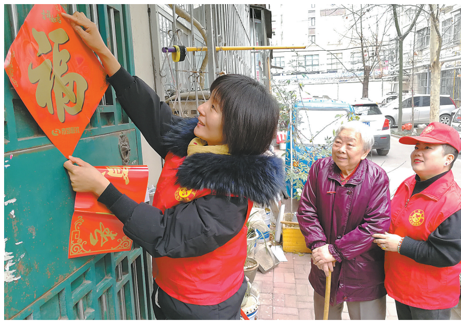
志愿服务社区老人

动10多户贫困户家门口就业,还可为村集体每年增收6万余元。春节前夕,花生油产销两旺。