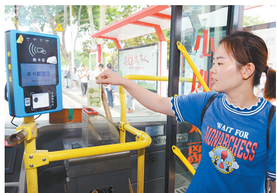
乘客在市区公交车上投币(摄于2019年7月1日)。当日起,我市公交车全面实施一元票制。

民心所向是幸福。2019年,我市民生答卷温暖而有质感;2020年,向着幸福,铿锵有力再出发。(本报记者 毛玺玺)