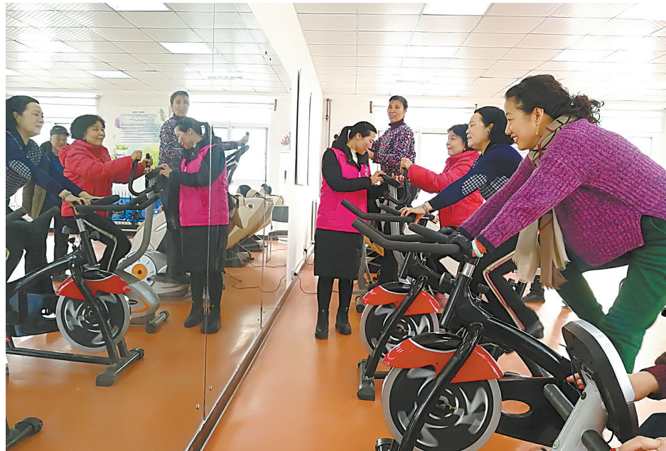
湛河区姚孟街道阳光苑社区居民在日照照料中心锻炼身体(摄于2019年2月12日)。

34897个;累计实现建档立卡贫困劳动力转移就业80679人,就业率100%;实现新增转移农村劳动力就业2.05万人,完成全年目标的146.51%。严格落实助学、免学费助学政策和贫困家庭学生建档立卡制度,对贫困劳动力开展“点餐式”培训,免费培训建档立卡贫困劳动力80024人,培训率达到100%。17万多符合参保条件的建档立卡贫困人口全部纳入城乡居民基本养老保险覆盖范围,为5735名无力缴纳养老保险费的建档立卡贫困人口代缴保费57.35万元,共有5.63万名建档立卡贫困人口每月按时领取养老金,实现贫困人口应保尽保。