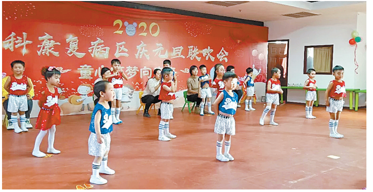
市中医院儿科举办元旦联欢会 为给在医院康复的孩子和家长提供一个尽情欢乐的舞台，上月31日下午，市中医医院儿科举办了元旦联欢会。图为联欢会现场。