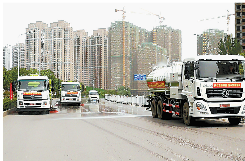
湛河区环卫局的两辆清扫车和一辆洒水车在市区开源路中段联合保洁(摄于2019年5月22日)

“散乱污”企业变绿地迎来新生。在平郊路与景区路交叉口附近，有一处“荒”了许久的废旧砖厂。如今，废旧砖厂一半植绿、一半停业，已变身为生态停车场。新华区在对辖区煤场、渣场、料场、采石场等矿区场院进行摸底排查后，对“散乱污”企业的原址进行了生态恢