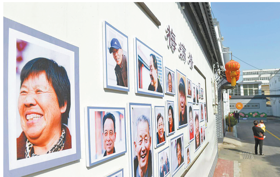
宝丰县在农村人居环境整治中融入文化因素,整治后的城关镇大寺新村面貌一新,充满文化气息。