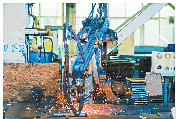
2019年12月31日,切割机机器人在平煤机矿机械装备有限公司车间内加工钢板。