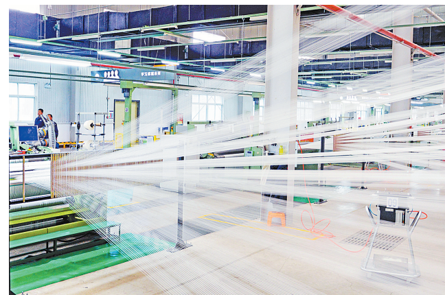
2019年12月31日,工人在平煤神马集团帘子布发展公司捻织车间巡检设备。