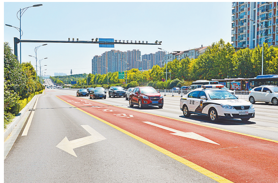
8月30日,改造后的长安大道路面平整、标线清晰。

高速公路建设提速加速。一年来,我市高速公路建设完成投资14.87亿元,周南高速平顶山段、郑西高速平顶山段主体工程全线贯通;绕城高速、焦唐高速、焦平高速已完成项目建设规划,并列入全省新一轮高速公路网规划。