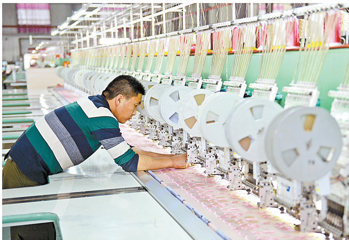
4月19日,汝州市汝绣农民工返乡创业产业园的工人在生产线上忙碌。