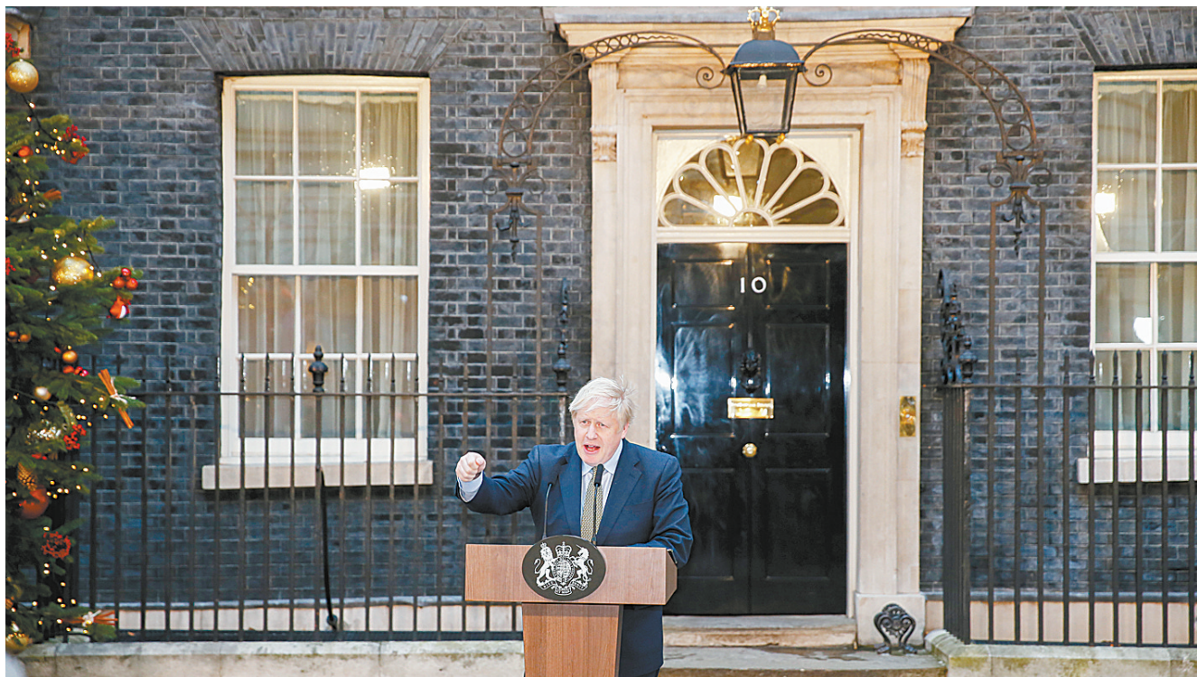
约翰逊就任英国首相发表演讲

12月13日,在英国伦敦,新就任的英国首相鲍里斯·约翰逊在唐宁街10号首相府发表演讲。