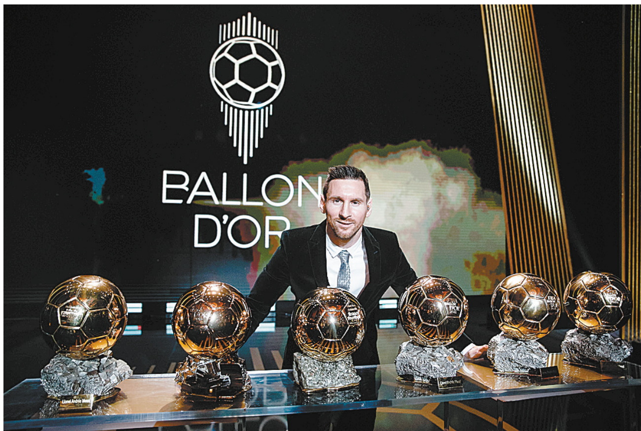
12月2日,梅西与金球奖奖杯合影。当日,2019年度金球奖在法国巴黎揭晓,效力于西甲巴塞罗那队的阿根廷球员梅西第六次夺得金球奖,成为历史上获得该奖项最多的球员。

新华社罗马12月2日电《法国足球》金球奖2日揭晓,克·罗纳尔多(C罗)连续两年与该奖项无缘。不过,C罗得到了他的俱乐部队友基耶利尼的力挺,后者认为C罗去年的金球奖是被抢走的。 去年的金球奖评选,皇马中场莫德里奇最终折桂,而今年这一奖项授予了梅西,C罗也连续两年缺席金球奖颁奖典礼。当有记者问到基耶利尼对于此事的看法时,尤文图斯队长说出了一番激烈的言辞。 “C罗原本应在去年获得金球奖,但被抢走了。我对莫德里奇非常尊重,他在去年的表现非常好,但仍不足以赢得金球奖。那是皇马发出的信号,他们想阻止克里斯蒂亚诺(C罗)拿奖。” 此外,基耶利尼还质疑了金球奖的评选标准。“莫德里奇去年拿了欧冠冠军,按照这个逻辑,今年的金球奖应该属于范迪克。此外,格里兹曼、博格巴和姆巴佩都在2018世界杯上表现得很好,莫德里奇拿奖没有道理。” 金球奖由《法国足球》杂志于1956年创立,C罗此前曾五次赢得这一奖项。