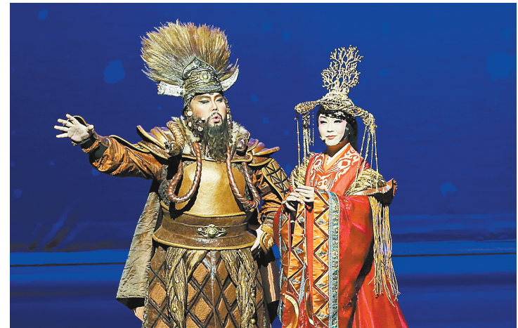
《昭君出塞》亮相美国圣迭戈

此外,利物浦队门将阿利松·贝克尔获得今年新设立的雅辛奖。2019年,这位巴西人帮助利物浦队赢得欧冠冠军、英超亚军,随巴西国家队赢得美洲杯冠军,而且被评为英超、欧冠和美洲杯最佳门将。在今天的国际足联颁奖典礼上,他赢得最佳男门将这一奖项。 金球奖由《法国足球》杂志于1956年创立,结合球员一整年表现,由足球专业记者投票选出。金球奖在2010年与国际足联世界足球先生奖项合并为国际足联金球奖,但两大奖项在2016年再度分离。