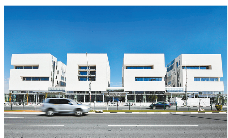
卡塔尔“2022”楼群落成开放

本报讯(记者卢晓兵)12月2日,据市文化艺术中心主任孙鹏介绍,12月份该中心将举办“倡导环保行为·共创绿色鹰城”优秀电影展映活动。 该中心五厅(大型综合放映厅)展映的电影有《花开飘香》《北斗风云》《神探蒲松龄》《浴火焚情》《花喜鹊》《英雄无悔》《引爆者》《兄弟别闹》《大坏狐狸的故事》《悟空奇遇记》《超级幼儿园》《大闹西游》《草根秀才》《江城