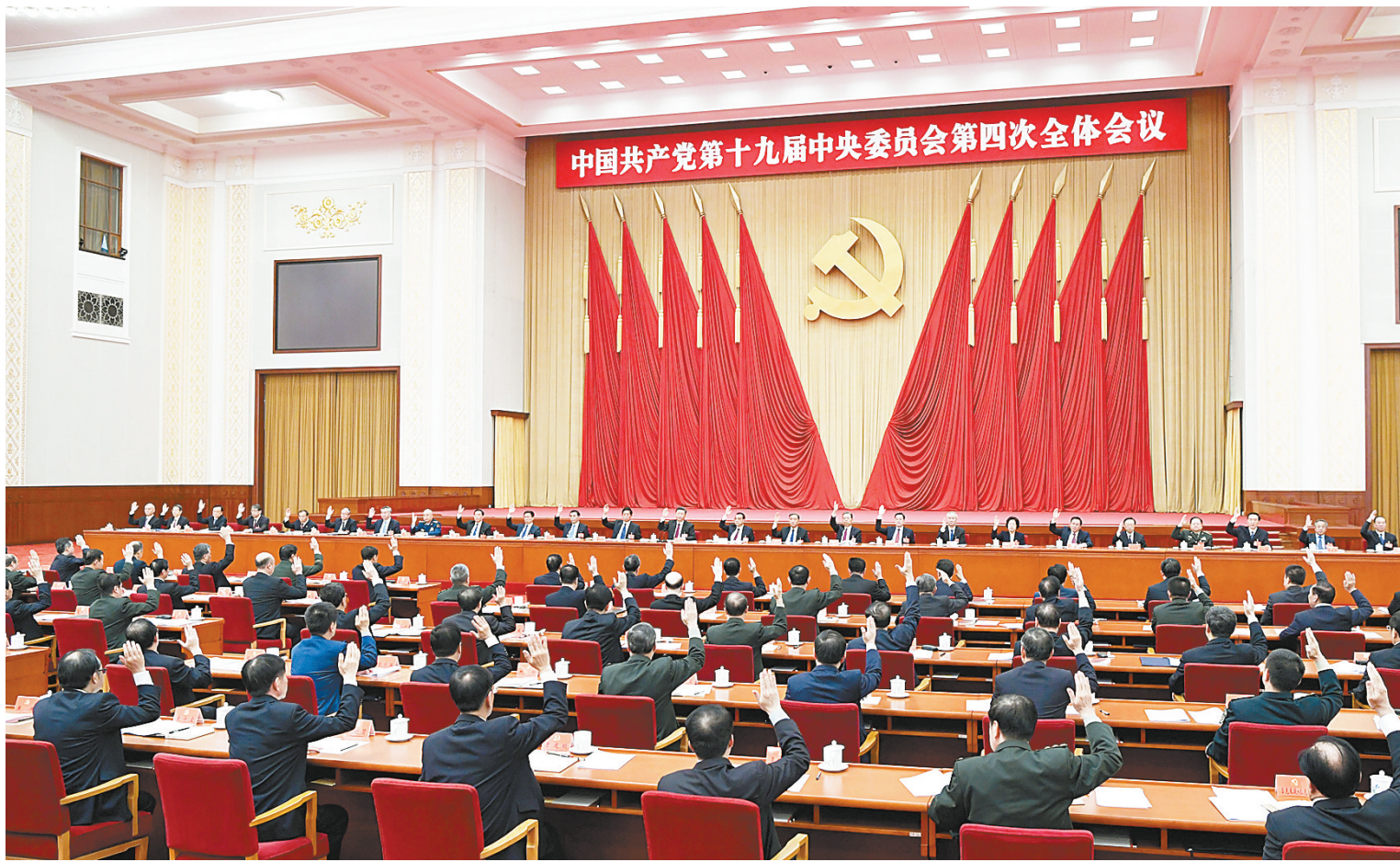
中国共产党第十九届中央委员会第四次全体会议，于2019年10月28日至31日在北京举行。中央政治局主持会议。