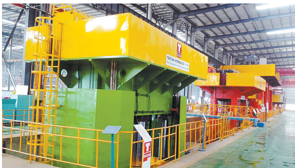
河南泰田重工机械制造有限公司车间