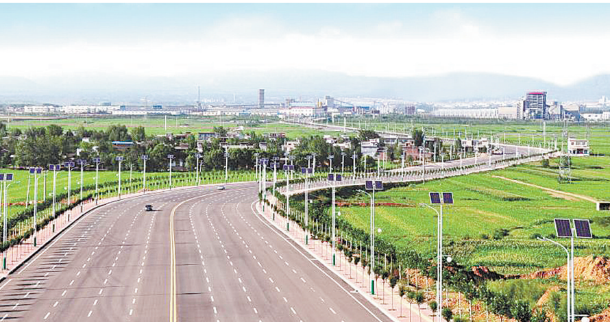
汝州市产业集聚区梁高南路