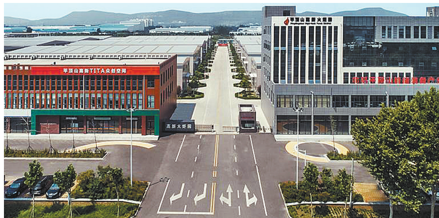
平顶山高新技术产业开发区双创孵化基地(高新火炬园)