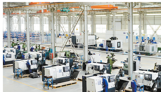
河南铁路装备制造股份有限公司生产车间