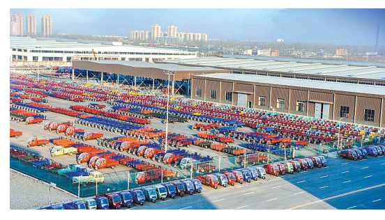
河南隆鑫汽车有限公司厂区