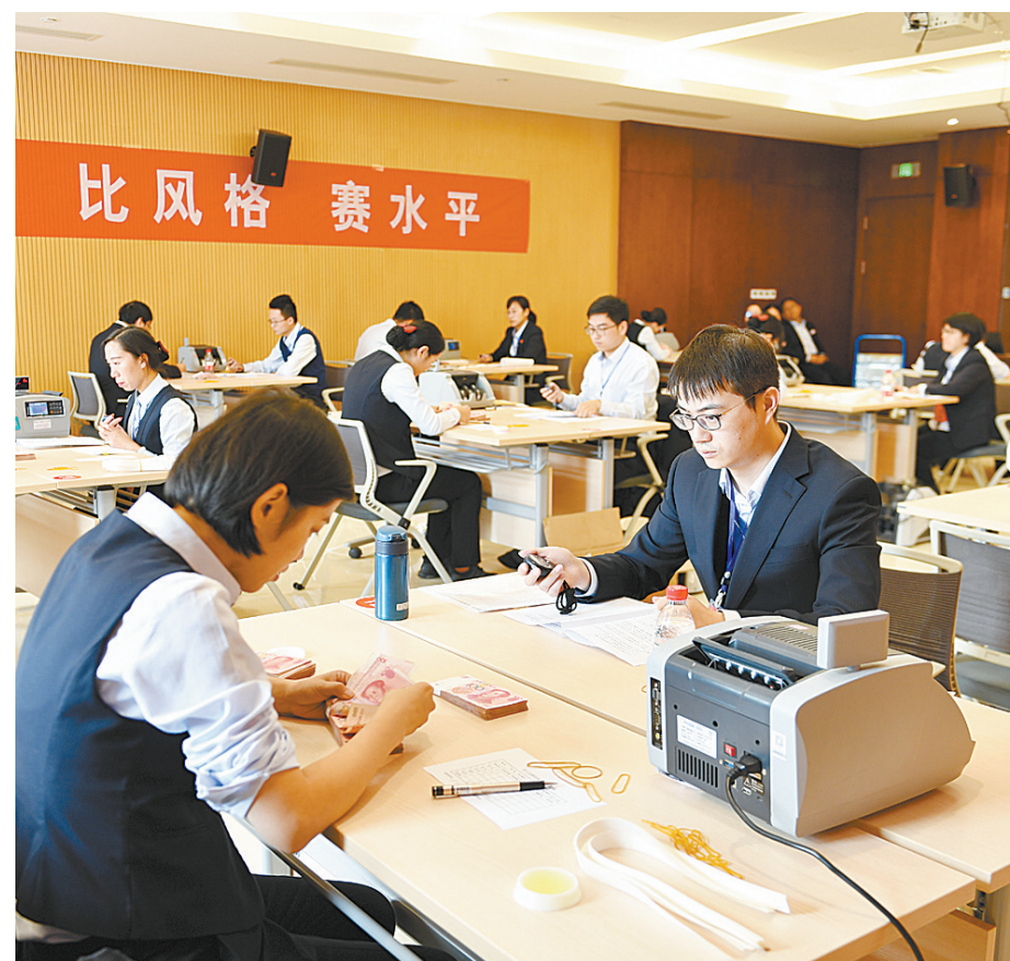
平顶山银行举办技能竞赛

良好氛围。本次观看爱国影片活动,是平顶山银行在9月20日参观爱国主义教育基地淮海战役陈官庄地区纪念馆后的系列活动之一,通过观看电影最大限度地激发全行党员的爱国热情,继而激发全行干部职工干事创业的激情。