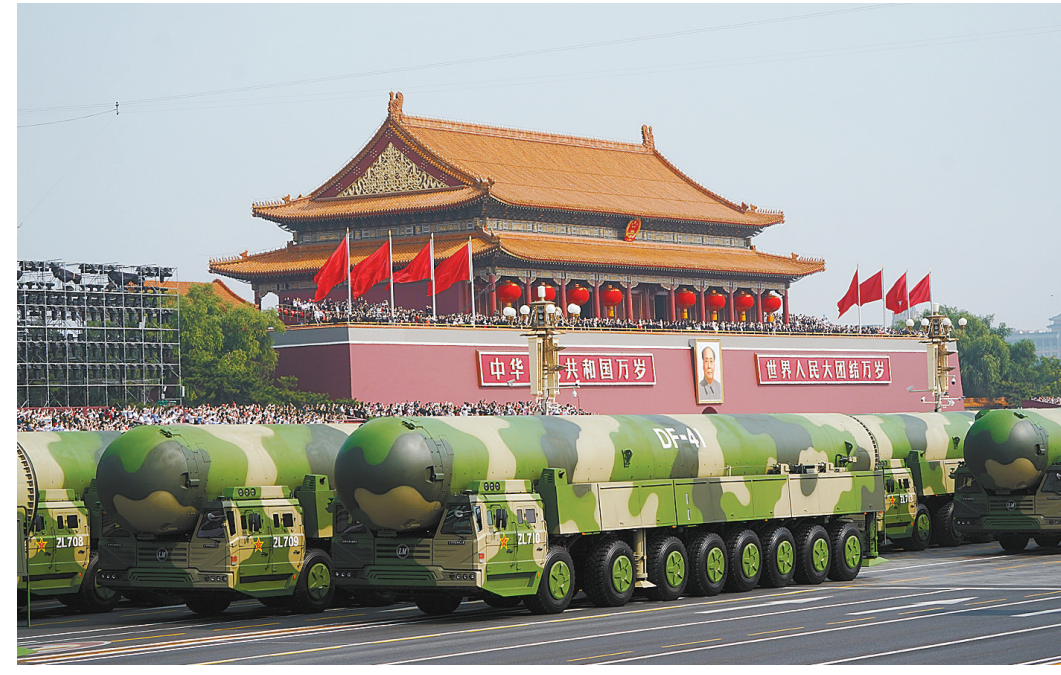
10月1日上午,庆祝中华人民共和国成立70周年大会在北京天安门广场隆重举行。这是东风-41核导弹方队。