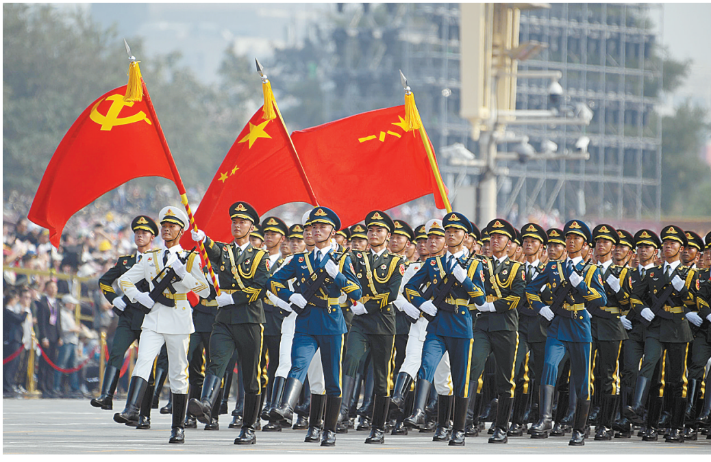
10月1日上午,庆祝中华人民共和国成立70周年大会在北京天安门广场隆重举行。这是行进中的仪仗方队。