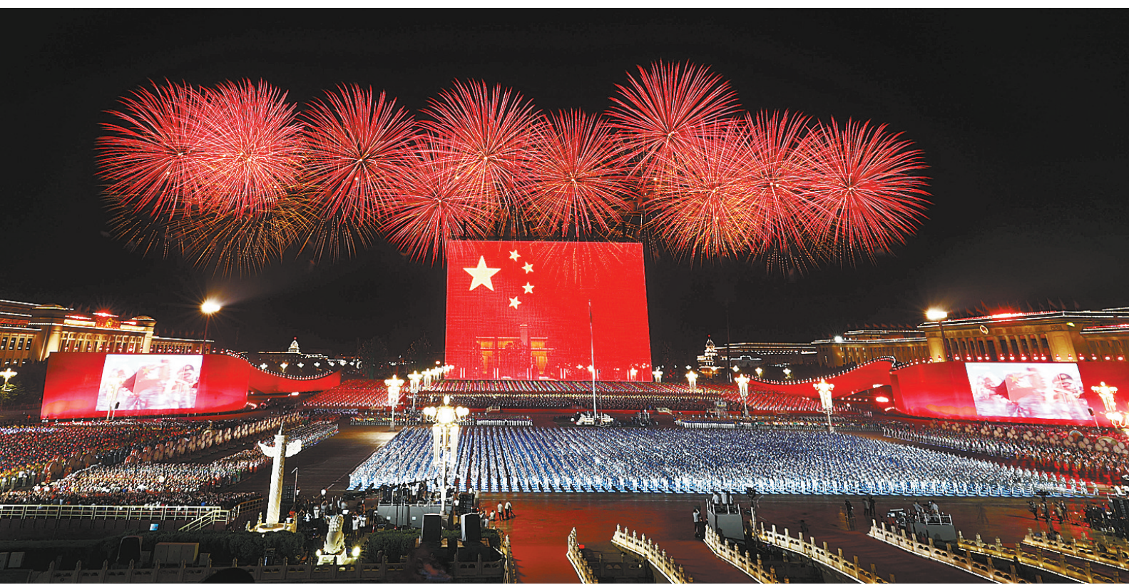
10月1日晚,庆祝中华人民共和国成立70周年联欢活动在北京天安门广场举行。这是联欢活动现场。

序章“红飘带”,拉开了联欢活动的序幕。在庄严的礼炮声和雄浑的交响乐曲声中,3000多名表演者汇聚在一起。