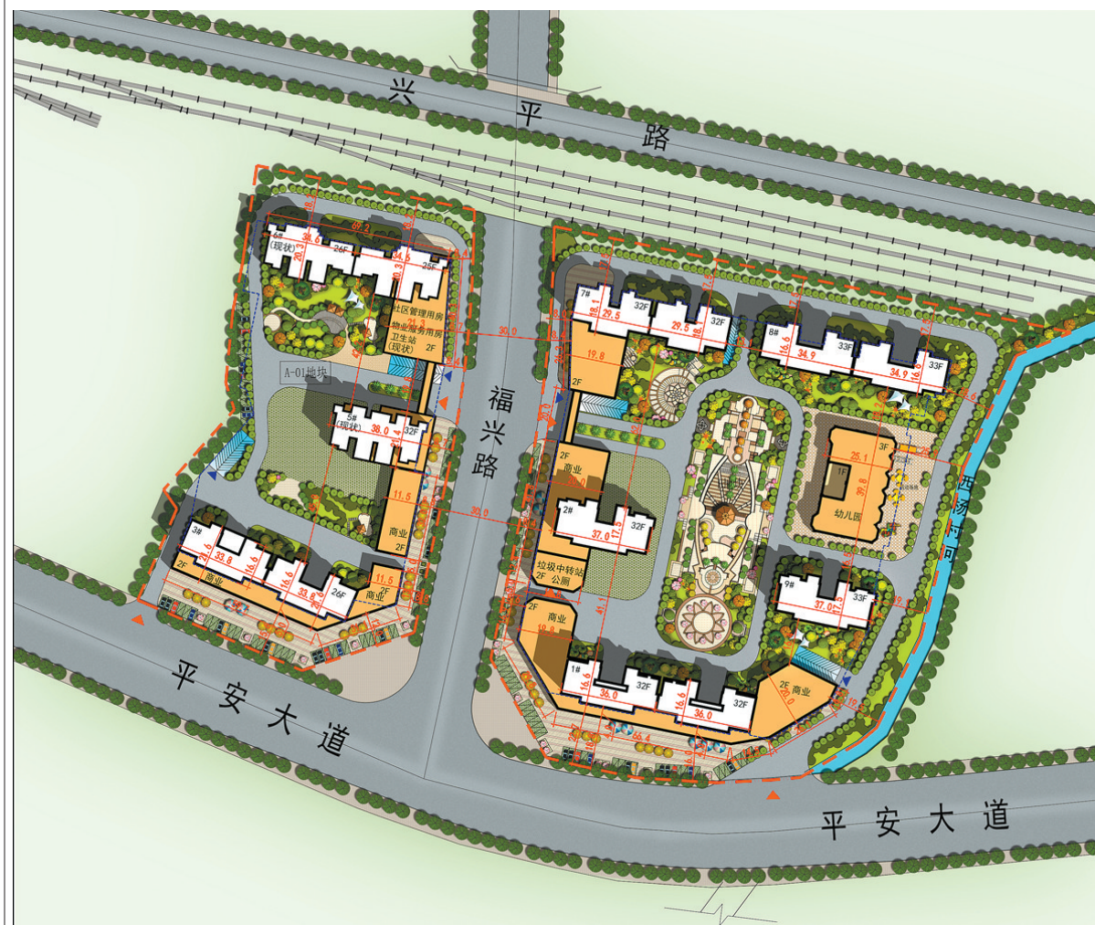
总平面及相对尺寸定位图