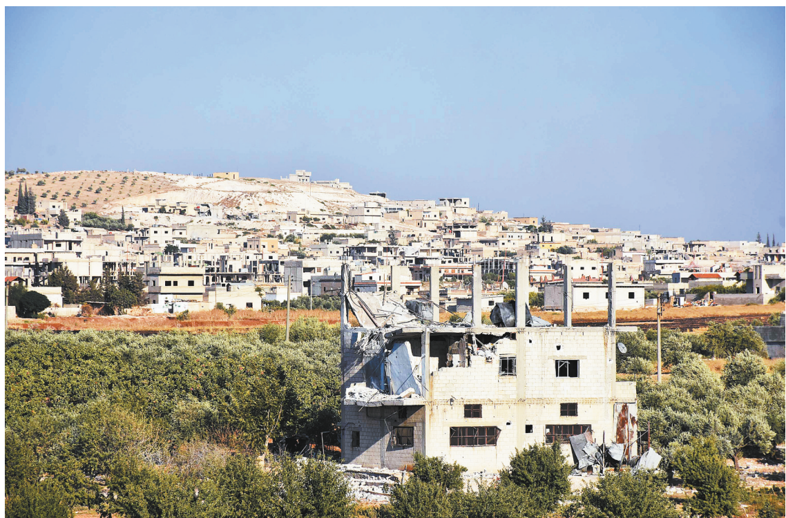
叙政府军收复伊德利卜省重镇汉谢洪

中方希望,美方继续按照两国元首阿根廷会晤共识和大阪会晤共识,回到磋商解决分歧的正确轨道,和中方一道朝着终止经贸摩擦的目标作出切实努力。