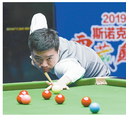
西藏斯诺克巅峰对决 丁俊晖不敌塞尔比

江汉关博物馆计划在8月17日首场博物馆之夜举办“江汉关博物馆奇妙夜”特色活动。中国共产党纪律建设历史陈列馆除了日常展览外,还将举办夜间小剧场。