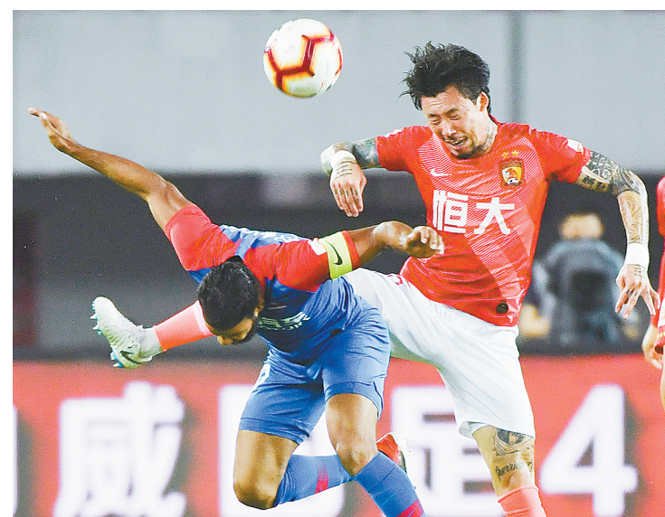
战平重庆 恒大连胜势头被终结

此次全新出版的生活散文集分为“人生感悟”“生活雅趣”“人间生灵”“旅行印象”四辑。“人生感悟”收录作家对人生重大际遇、亲友交往和世事的感慨之作;“生活雅趣”记录作家工作之余的生活趣味,如书画音乐、遛鸟寻宝、香烟美食;“人间生灵”不仅写春夏秋冬、花鸟鱼虫,更有世间之人、人间之情;“旅行印象”收录作家游历国内外、守护文化遗产的自然散文。