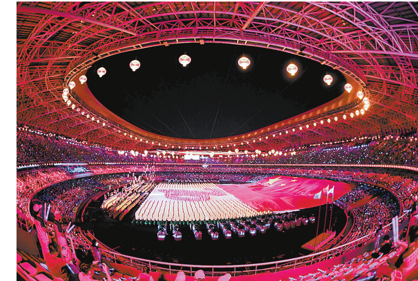
8月8日,演员在开幕式上表演。

日前举办的《延安往事》建组会暨剧本朗读会上,国家京剧院院长宋晨说,延安(京)剧研究院、延安京剧人实践我们党对待中外文化遗产的方针,以接受和运用广大民众喜爱的“旧剧”遗产为己任,让京剧艺术在宝塔山下焕发了新的生机。为人民服务,是京剧人不变的初心与使命。