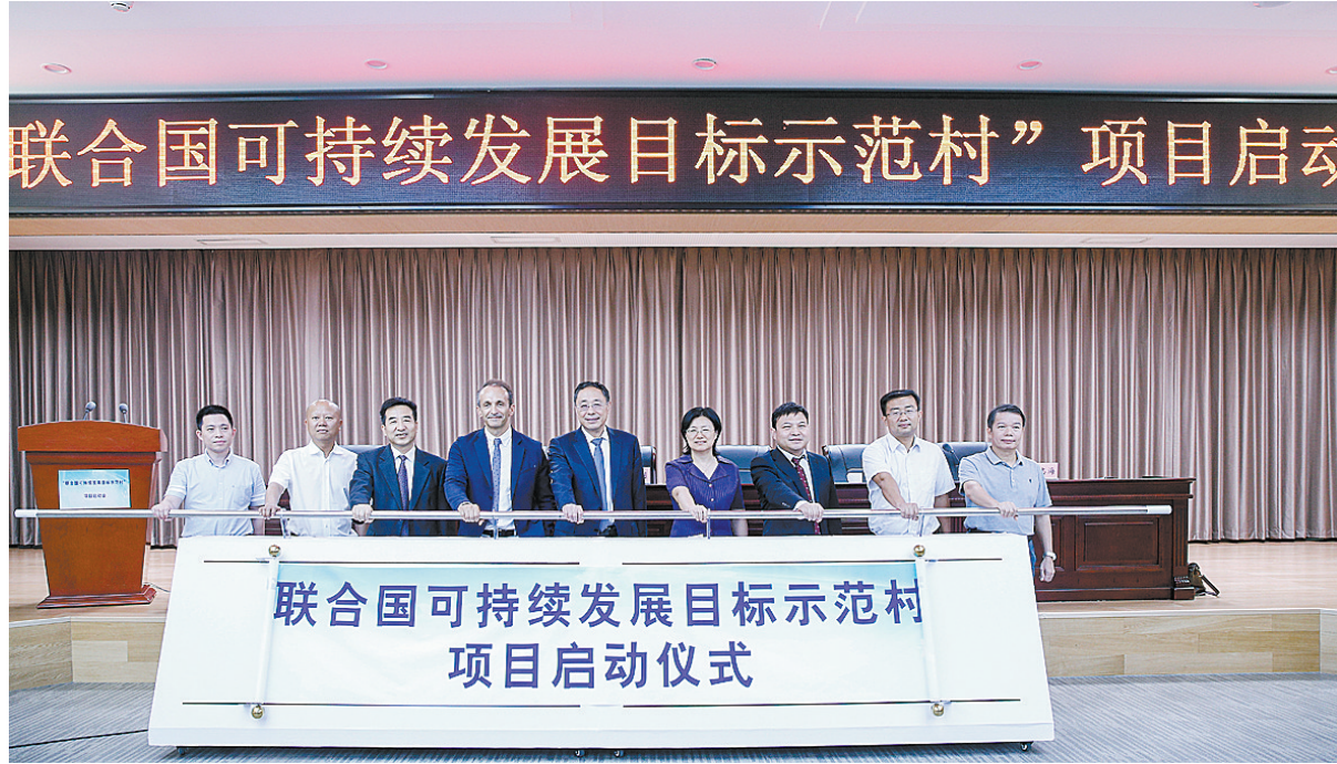
“联合国可持续发展目标示范村”项目启动仪式

“我们将坚定不移推进经济转型、脱贫攻坚，坚定不移实施建设，编制完成了生态区建设规划和工矿废弃地综合治理方案，认真落实“生态石龙”“宜居石龙”建设目标；建立健全河长制，对河道沟渠进行生态修复；积极落实乡村振兴战略，推进