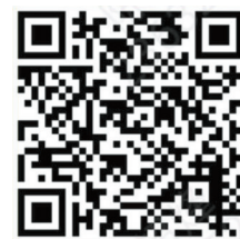
建行ETC小程序二维码