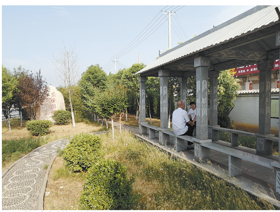
村民在东营村游园休憩

利用村集体30亩坑塘、征用周边土地100亩，建成东营村大型植物园，人均绿地面积6平方米；对村周边道路两侧深沟进行黄土填平，实施廊道绿化，建设游园，共栽植绿化树木30000多棵，全村绿化围合率100%。 同时，该村实施亮化工程，在全村道路上安装太阳能路灯500多盏；新建一座自来水厂，铺设管线20000多米，家家用上干净的自来水；实施天然气入村工程，户户用上洁净水。 为巩固人居环境整治效果，该村根据人居环境整治要求修改村规民约，并将改善农村人居环境纳入村级年度任务目标和村干部绩效工资考核范围，实行村组干部分区包街责任制；村卫生保洁由河南美丽家园保洁公司全面托管，为每户村民家配备一个垃圾桶，街道上每12户设置一个大垃圾桶，实现垃圾集中收集转运，做到日产日清；每人每月收取1元保洁费，建立财政投入和村民适当缴费相结合的经费保障制度。 “如今的东营村绿树环绕、风景秀丽，街道干净整洁、环境优美。”周流长说，该村将抓住农村人居环境整治的契机，把“以人为本，服务群众”作为一切工作的出发点，全力打造管理有序、服务完善、文明祥和的新型农村社区。