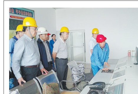
检查饲料添加剂生产企业

开展“瘦肉精”专项整治，确保畜产品质量安全。连年开展“瘦肉精”专项整治行动，制定专项整治方案，细化投入品、养殖、屠宰和收购贩运4个环节的监管措施。严把饲料生产经营环节关。重点检查饲料生产企业有无非法添加“瘦肉精”等违禁物质、饲料经营门店是否有拆包、分装饲料的行为。严把养殖环节关。推进养殖场(户)“瘦肉精”自检和部门监督抽检相结合的管理机制，定期对养殖企业(场户)进行巡查抽检，并督促养殖场(户)进行“瘦肉精”自检，建立自检记录。严把屠宰环节关。严格执行屠宰检疫程序，按照日屠宰量3%的比例对屠宰生猪进行“瘦肉精”检测。严把收购贩运环节关。对出栏生猪实行到场到户产地检疫并按2%的比例进行“瘦肉精”抽检，经检测阴性并检疫合格者方出具产地检疫证。两年来，全市共抽检“瘦肉精”尿样2万余批次，结果全部为阴性。