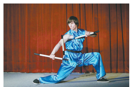
第18届“汉语桥”世界大学生中文比赛波黑赛区选拔赛结束

2019年女足世界杯将于6月7日至7月7日在法国举行。中国女足与德国、西班牙和南非队分在B组。