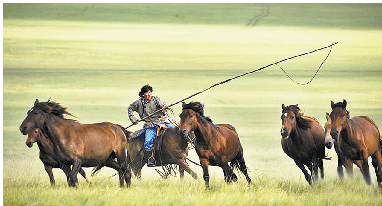
呼伦贝尔草原:套马的汉子

征文时间从即日起至12月底,来稿请发送至 pdsrbk@126.com,并在“邮件主题”处注明“我和我的祖国”征文字样。