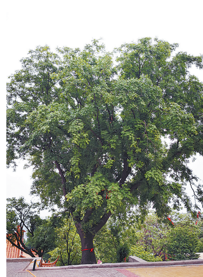
▲包公祠内有棵粗壮的皂角树,树龄已有上千年