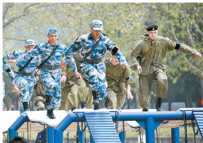
中俄海上联演举行陆战队军事竞赛 4月30日，中俄海军陆战队队员在400米障碍赛中。当日，中俄“海上联合—2019”军事演习陆战队军事竞赛举行。中俄两国海军陆战队队员就步枪精度射击、战斗射击、狙击枪射击及400米障碍等4个科目进行竞赛。

◆习近平同老挝人革党中央总书记、国家主席本扬举行会谈，一致表示愿推动中老命运共同体建设不断向前迈进，共同开启中老关系新时代 ◆习近平给老挝中老友好农冰村小学全体师生回信 ◆李克强主持召开国务院常务会议，确定使用1000亿元失业保险基金结余实施职业技能提升行动的措施，讨论通过高职院校扩招100万人实施方案 ◆李克强签署国务院令，公布《国务院关于在线政务服务的若干规定》 ◆教育部、中央军委国防动员部联合召开全国大学生征兵工作网络视频会议，标志着2019年度全国大学生征兵工作全面展开（均据新华社）