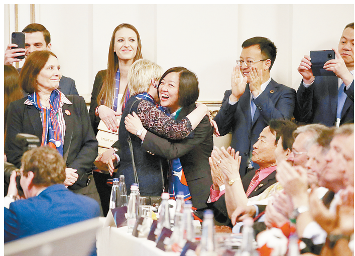
成都获得2022年世乒赛团体赛举办权

华传统文化百部经典》已出版的15种图书展出。其中三册珍贵善本:宋两浙东路茶盐司刻本《尚书正义》、宋刻本《孟子集注》、宋两浙东路茶盐司刻宋元递修本《周易注疏》仅展出一个月。 据介绍,23日,“文津图书奖”专题网站资源正式推出“传承经典 好书共读”专题页面,包括“好书共读”“邂逅经典”“大师微讲堂”三个栏目。国家图书馆手机门户、数字图书馆移动阅读平台以及国家图书馆微信订阅号、服务号等也会发布文津图书奖相应内容,读者可以通过电脑、手机等随时参与互动。