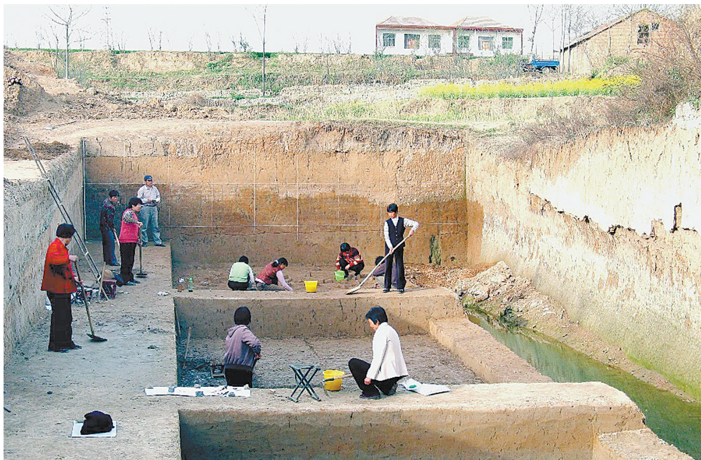
裴李岗文化是目前已知的较早的新石器文化，因最早在新郑裴李岗村发现认定而命名，图片为挖掘现场。

郟县历史文化源远流长，境内有国家级文物保护单位4处，全国历史文化名镇(村)3处，国家级传统村落16处，省级文物保护单位11处，市级文物保护单位15处，县级以及新发现的文物保护单位602处。在这些已发现的文物保护单位中，水泉裴李岗文化遗址以面积大、遗迹丰、年代久而颇具历史研究价值，并在我国裴李岗文化研究中有着一定的地位。