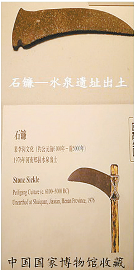
石镰—水泉遗址出土

1977年，《河南新郑裴李岗新石器时代遗址》一文发表后，引起了中国考古界的广泛重视；1978年春，河南省博物馆对密县裴李岗文化遗址作了大规模发掘；同年开封地区文管会等对裴李岗遗址作第二次发掘；1979年中国科学院考古研究所对裴李岗遗址进行第三次发掘；1980-1981年，河南省博物馆及中国科学院考古研究所分别对河南境内的裴李岗文化遗存进行了普查，发现了数十处聚落遗址。此后，中国社会科学院考古研究所先后对郟县水泉、许昌丁集、临汝中寨、新郑沙窝李和信阳南山嘴遗址进行了试掘。河南省文物研究所对长葛石固和舞阳贾湖遗址进行了大规模发掘，均取得了丰硕成果。