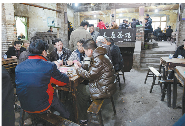
茶客们在重庆交通茶馆喝茶打牌(资料图)。