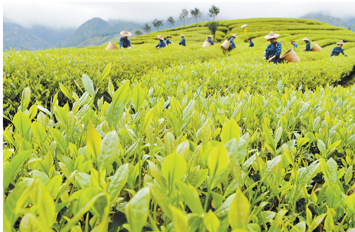
4月14日,采茶女在武夷山星村镇朝阳村生态茶园里采茶。