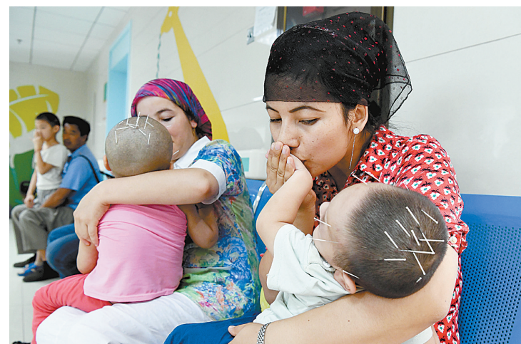
来自新疆的患儿家属亲吻接受针灸治疗的孩子(2016年8月30日摄)