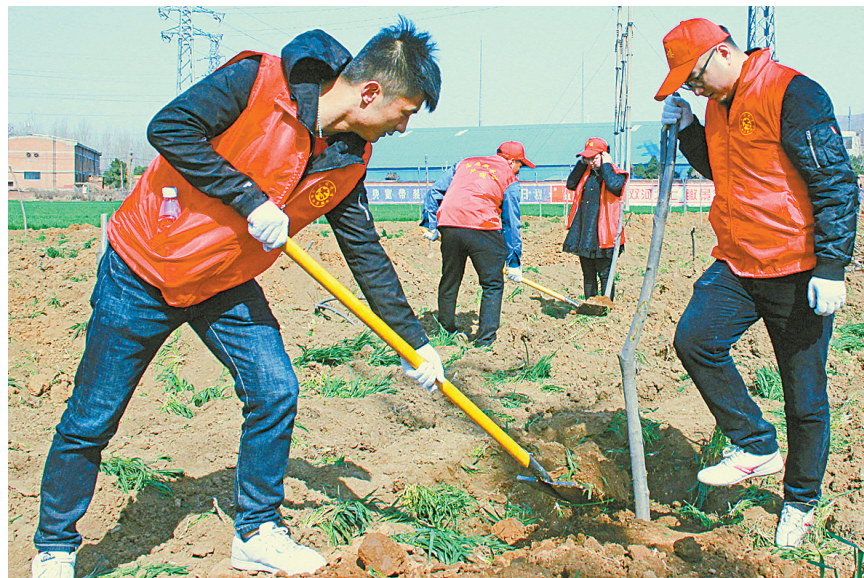
3月12日，青年志愿者在“散乱污”企业取缔后整理出的土地上种植树苗。当日是一年一度的植树节，卫东区中楼街道根据上级统一部署组织“中楼青年”志愿服务队全体人员开展国土绿化义务劳动，在辖区“散乱污”企业取缔后整理出的土地上种植绿化苗木、美化人居环境。

区里的树木定期进行除草、松土、浇水，使其茁壮成长，积极为绿满鹰城作贡献。众人拾柴火焰高，让我们共同努力，使鹰城林木葱郁，更加出彩。