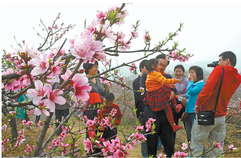
游人在鲁山县下汤镇万亩桃园游玩(资料图片)。

8家旅游企业创建成为国家A级旅游景区 A级景区达30家 旅游商品生产企业200多家 旅游业从业人员10万人