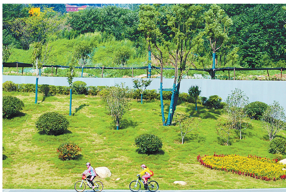
两位游人骑车从乌江河口公园水舞广场景观节点驶过(资料图片)。