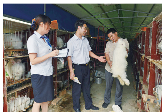
与养殖专业合作社对接,了解信贷需求

截至去年底,全市农信社小微企业贷款较年初净增 58.2亿元 ,存量客户达到 68862户 ,占新增贷款的 79.1% ,贷款余额达 339.8亿元 ,占各项贷款的 65.5% ,占全市金融机构的四成左右。