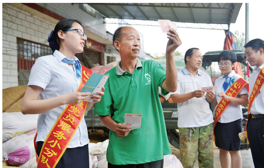
进村入户讲解金融知识

金融是现代经济的核心,也是经济社会发展的血液和命脉,直接决定着经济社会的发展。近年来,平顶山农信系统紧紧围绕全市经济社会发展大局,主动融入、勇于担当、积极作为,在服务乡村振兴、助推脱贫攻坚、支持民营经济发展等方面发挥了重要作用,用实际行动生动诠释了“服务三农、改善民生”的使命担当。