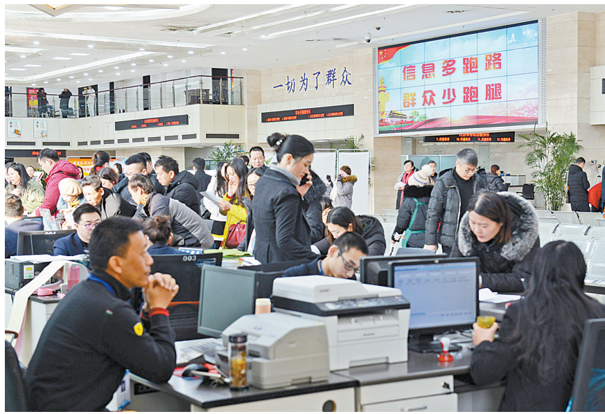
市民在行政审批服务大厅办理业务(资料图片,摄于2018年12月28日)。我市启动政务服务“马上办、网上办、就近办、一次办”以来,不断拓宽服务渠道,优化办理流程,努力打造全省一流的“一次办妥”政务服务品牌。

新时代改革大潮,新征程帆风顺。2018年,我市把全面深化改革作为重大政治责任和重要发展机遇,深入贯彻习近平总书记全面深化改革重要思想,认真落实中央、省委的决策部署,深入开展“争试点、创亮点、抓重点”行动,扭住关键环节,大胆探索创新,纵深推进各项改革落地见效,动力活力竞相迸发,推动高质量发展取得积极进展,人民群众获得感、幸福感和安全感不断增强。 “一次办妥”改革全面推行,“僵尸企业”处置稳步推进,投融资体制改革逐步深化,“互联网+医疗健康”闯出“平顶山模式”,叶县“十权同确”农村集体产权改革在全省率先启动,郑县“四组一队”基层妇联改革新模式在全省推广,高新区人事和薪酬制度改革扎实推进,圣光供应链管理药房延伸服务创新模式成效显著……过去一年,我市新增11个国家改革试点,全面深化改革全方位、多点多突破、纵深推进,一幅风生水起的改革画卷跃然眼前。