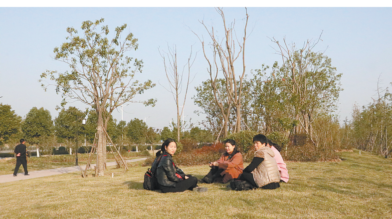
市民在公园游玩。

在大力实施园林项目的同时,宝丰县还开展了以绿化、亮化为重点的环境综合整治,对城区所有公园游园的景观灯、植被花草、娱乐健身器材等进行提档升级改造,采取借景、对景、分景、隔景等手法来组织空间,达到了曲折多变、小中见大、虚实相