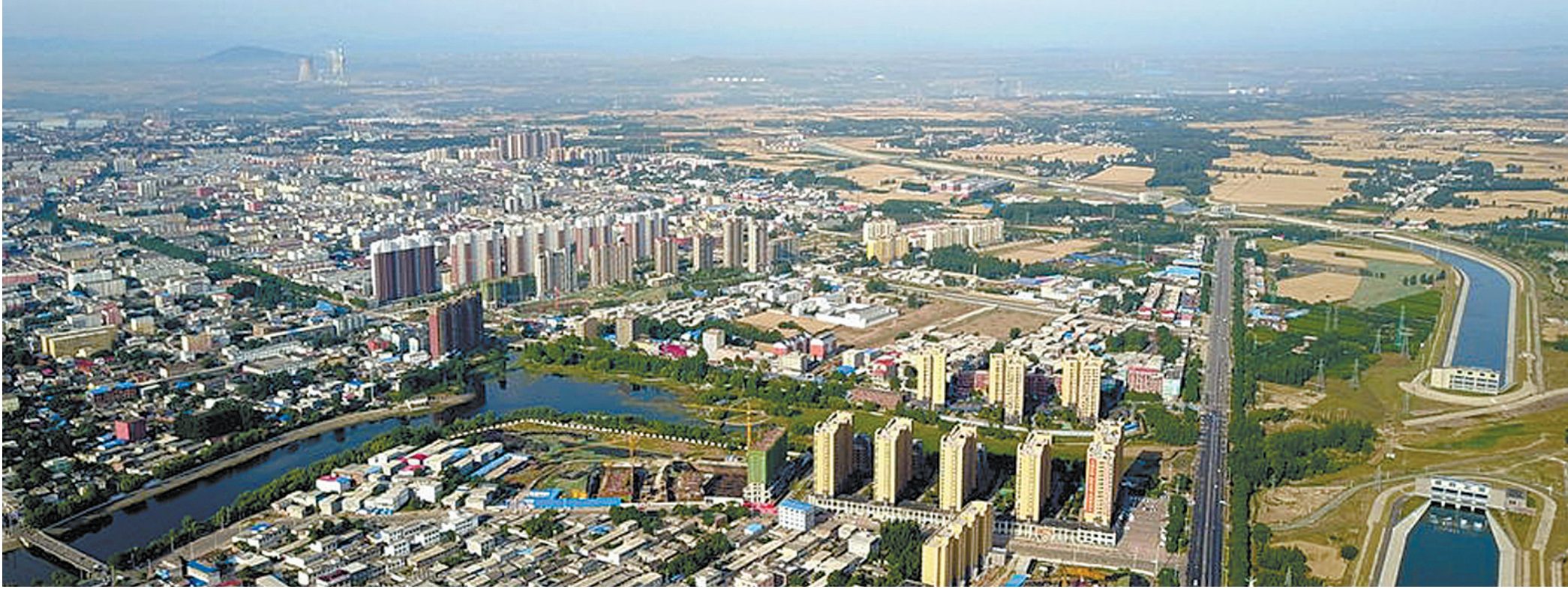
县城鸟瞰图