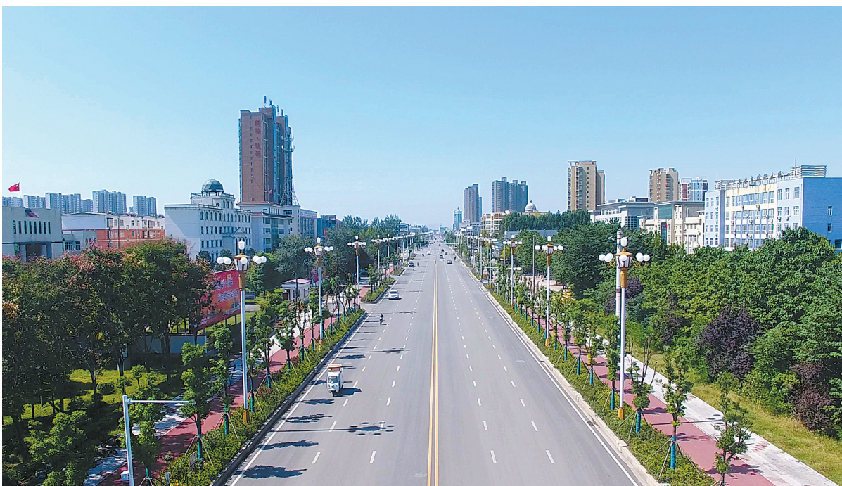
县城人民路已成为林荫大道。

宝丰县住房和城乡建设局局长陈晓明说,百城提质,既要提升城市“颜值”,又要彰显城市特色。宝丰县按照“城市双修”实施方案,大力实施旧城改造工程,在老城区推进棚户区改造项目,对主干道建筑物外立面进行改造,推动城区地下智能停车场、集中供热、城乡环卫一体化等项目建设。同时,围绕城市文脉、城市色彩等要素,进行城市设计,力求凸显宝丰的历史文化特色,提升城市品质与“颜值”,展现城市文化底蕴。