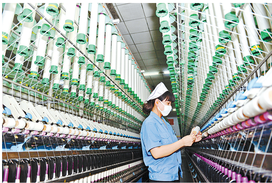
2018年6月5日,宝棉工业园区员工在生产线上加紧生产(资料图片)。2015年,平棉集团主动退城进园,到宝丰县新建宝棉工业园区,主动践行绿色、环保、可持续发展的理念,在技术水平、装备水平、产品档次、劳动生产率等方面得到了大幅提升。

一手抓传统产业升级改造,一手抓新兴产业培育壮大,是我市转型发展打出的“两张牌”。为培育壮大新兴产业,我市制定了加快培育发展新兴产业集群实施方案,明确重点培育发展尼龙及化工新材料、新能源、智能装备制造等8个新兴产业;积极推动尼龙新材料产业发展上升为省级战略,推动尼龙产业发展步入快车道;规划编制了《尼龙新材料基地总体规划》,举办了2018中国(平顶山)尼龙新材料产业技术发