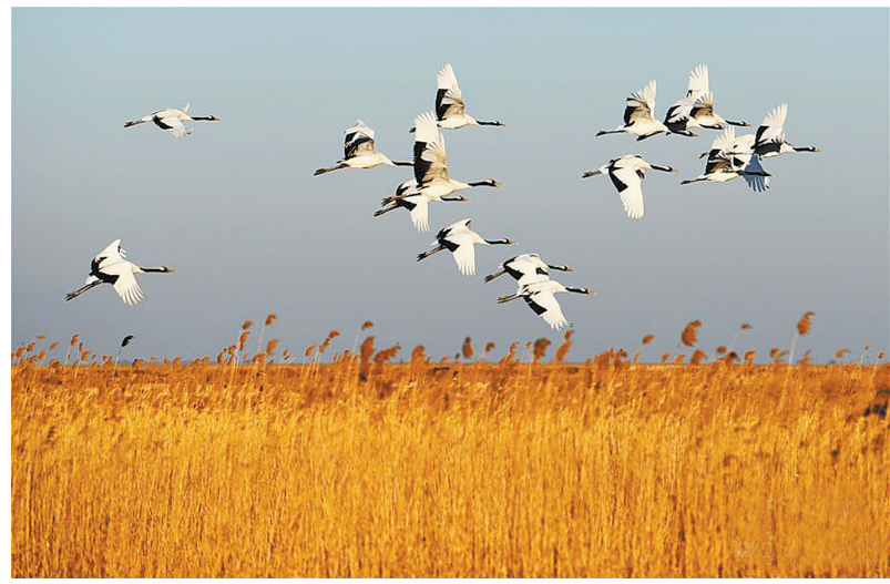
鹤舞寒冬 新华社发