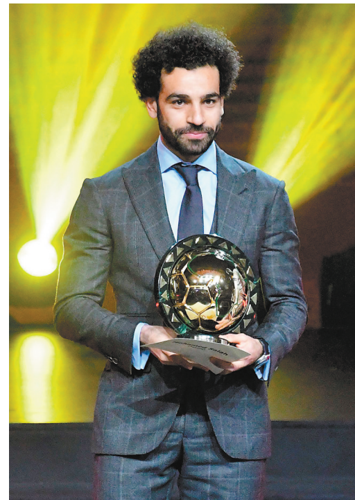
1月8日,萨拉赫在颁奖仪式上捧奖杯。

萨拉赫目前效力于英超利物浦。2017-2018赛季,他荣膺英超金靴和最佳球员,并帮助利物浦队打入欧冠决赛。国家队比赛中,他代表埃及在2018年俄罗斯世界杯攻入两球。