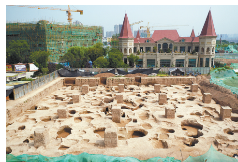
这是西安马腾空遗址局部(资料照片)。

此外,考古人员在遗址区北部发现了一段残存长约88米、宽10米、现存深约2.2米的仰韶晚期聚落环境,环境内有同时期的房址、灰坑、陶窑、墓葬。这是陕西关中地区首次发现仰韶晚期带环境的聚落,增加了西安地区史前时期环境聚落的资料,对研究同时期聚落布局、葬俗、人种、人群等级分化等提供了新材料。