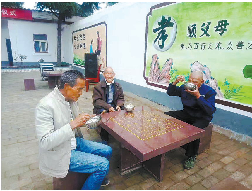
农村幸福院内，贫困老人安享晚年。