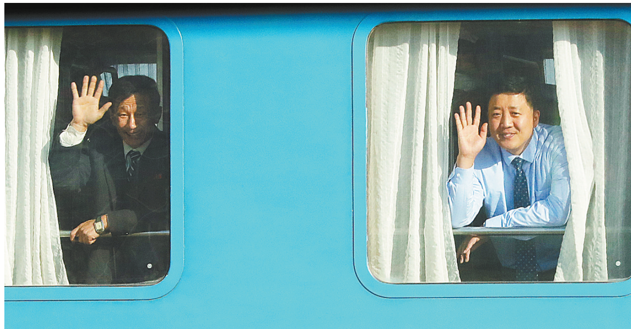
12月26日,在朝鲜开城市板门店,搭载火车的朝方人员向韩国记者挥手。据韩国统一部26日确认,韩国和朝鲜当天上午10时(北京时间9时)左右在位于朝鲜开城市的板门店举行京义线和东海线铁路及公路连接工程动工仪式。