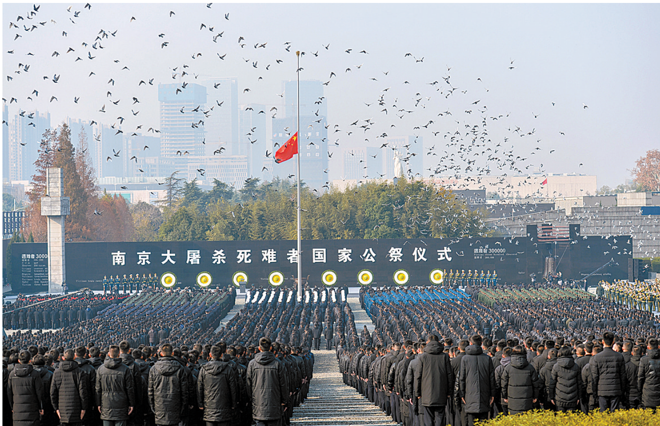
▲12月13日,南京大屠杀死难者国家公祭仪式现场放飞和平鸽。新华社记者 季春鹏 摄

副主席王正伟和中央军委委员张升民出席。 参加过抗日战争的老战士老同志代表,中央党政军群有关部门和东部战区、江苏省、南京市负责同志,各民主党派中央、全国工商联负责人和无党派人士代表,港澳台同胞代表,为中国人民抗日战争胜利作出贡献的国际友人或其遗属代表,南京大屠杀幸存者及遇难同胞家属代表,国内外相关主题纪念(博物)馆代表,国内有关高校和智库专家代表,中日韩宗教界代表,驻宁部队官兵代表,江苏省各界群众代表等参加公祭仪式。 2014年2月27日,十二届全国人大常委会第七次会议通过决定,以立法形式将12月13日设立为南京大屠杀死难者国家公祭日。