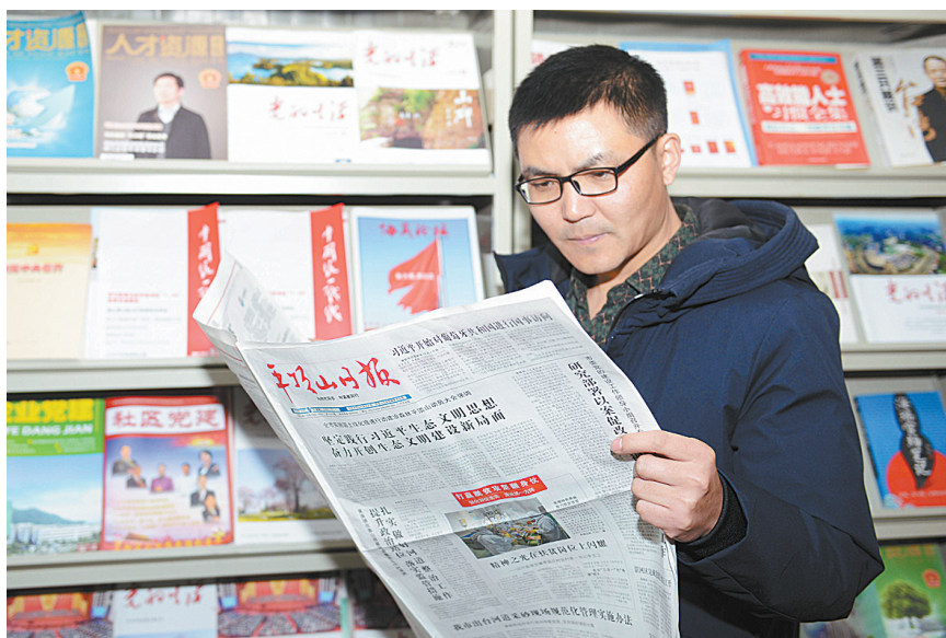
12月5日,新华区香山管委会工工委工作人员在四化路社区廉政书屋阅读平顶山日报。

济沧海。在有党报党刊相伴的日子,我一定会乘风破浪,冲开险阻,远渡沧海,实现自己的远大理想。