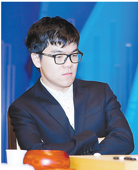
12月5日,柯洁在比赛中。