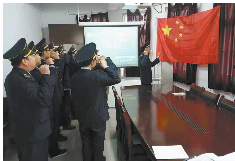
湛河区卫计委举行国家宪法日宣誓仪式

此次培训邀请省消防协会专业人士讲授消防安全知识。通过知识培训、现场演练及了解全国发生的真实案例,大家学习了消防的应急处理办法,认识到了消防知识的重要性,提高了对突发事件风险源的警惕性和自救互救能力。