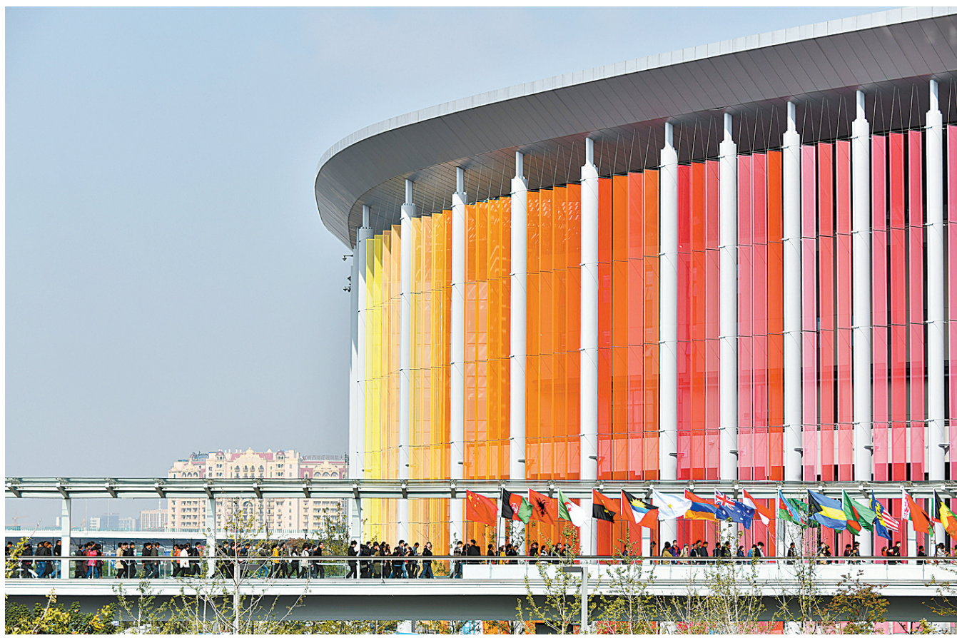
11月9日，观众通过天桥进入进博会场馆。首届进博会9日至10日安排团体观众实名制观展。

衣架的周围错落有致摆放着艺术品，试衣之余可以走进书屋，或是品尝一杯咖啡。进博会上，服装与工艺品、美妆等展台“搭台唱戏”，将视角从商业拓展到生